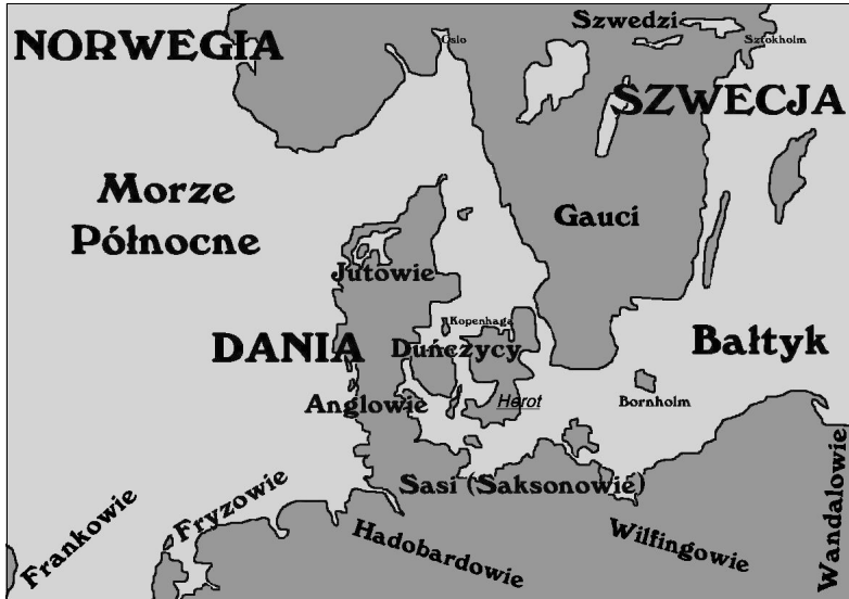
Południowa Skandynawia w czasach Beowulfa