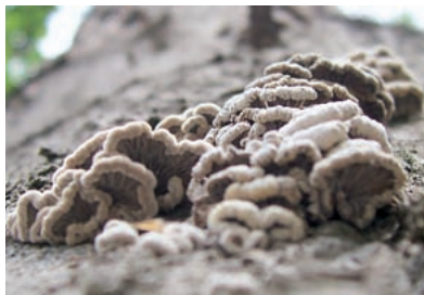
Fot. 7. Muszelkowate owocniki rozszczepki pospolitej – Schizophyllum commune Fr. (P. Łakomy)

Powierzchnia o wocników pok ryta jest mniej lub bardziej wadą skórki. Może ona łatwo odrywać się od miąższu (np. białoporek brzozy – Piptoporus betulinus (Bull.) P. Karst.) lub być silnie do niego przyrośnięta (np. pnirak obrzeżony – Fomitopsis pinicola (Sw.) P. Karst.). Powierzchnia może być równa, gładka lub nierówna – guzko wata, pagórko wata, bruzdowana, pofałdowana. Może być pokryta włoskami. Ich długość decyduje o tym, czy jest ona omszona, aksamitna, owłosiona, szorstka czy szczeniasta. Powierzchnia naga nie posiada włosków. Powierzchnia o wocnika może być różnie zabarwiona. Barwa z reguły ulega zmianie z wiekiem i stopniem wyschnięcia. Zależy również od rodzaju podłoża i warunków środowiska (np. nasłonecznienia, wilgotności). Czasem ulega