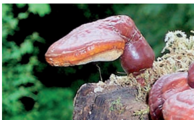
Fot. 8. O wocniki lakoownicy żółtawej ( Ganoderma lucidum Curtis) P. K. arst.) wrastają na trzonach (P. Łakomy)

Powierzchnia o wocników pok ryta jest mniej lub bardziej wadą skórki. Może ona łatwo odrywać się od miąższu (np. białoporek brzozy – Piptoporus betulinus (Bull.) P. Karst.) lub być silnie do niego przyrośnięta (np. pnirak obrzeżony – Fomitopsis pinicola (Sw.) P. Karst.). Powierzchnia może być równa, gładka lub nierówna – guzko wata, pagórko wata, bruzdowana, pofałdowana. Może być pokryta włoskami. Ich długość decyduje o tym, czy jest ona omszona, aksamitna, owłosiona, szorstka czy szczeniasta. Powierzchnia naga nie posiada włosków. Powierzchnia o wocnika może być różnie zabarwiona. Barwa z reguły ulega zmianie z wiekiem i stopniem wyschnięcia. Zależy również od rodzaju podłoża i warunków środowiska (np. nasłonecznienia, wilgotności). Czasem ulega