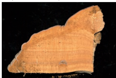
Fot. 2. Przekrój przez owocnik z wieloma warstwami hymenoforu (P. Łakomy)

Owocniki są specyficzne. Pojawiają się na ziemi, korzeniach, pniach i gałęziach zarówno z wycych jak i martwych drzew a także i na ich drzewnie. Tworzą się pojedynczo lub w skupieniach, ułożonych najczęściej rozetowato lub dachówkowato. Są zróżnicowane pod względem wielkości, trwałości, kształtu, charakteru powierzchni, konsystencji i budowy hymenoforu.