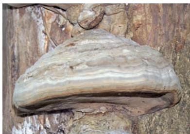
Fot. 6. Kopytowany owocnik hubiaka pospolitego – Fomes fomentarius (L.) J.J. Kickx