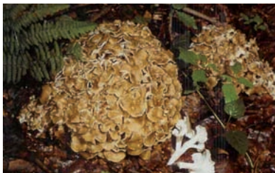
Fot. 9. Karczasty o wocnik żagwi wielogłowej ( Polyporus umbellatus (P. ers.) F. r.) składa się z wielu niewielkich kapeluszy ( J. Bräitenbach i F. Kränzlin, Fungi of Switzerland )

zmianie po dotknięciu lub uszkodzeniu. Nierówności, szorstkość oraz zabarwienie mogą układać się promieniście lub koncentrycznie.