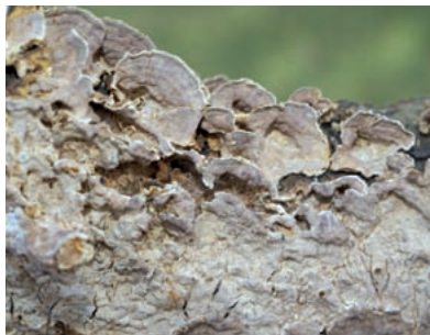
Fot. 4. Owocnik rozpostarto-odgięty szczecinkowca żółto-brzeżnego – Pseudochaete tabacina (Sowerby) T. Wagner et. M. Fish.