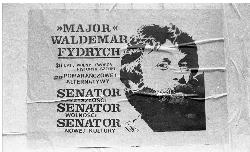
Plakat wyborczy Majora Waldemara Fydrycha z kampanii na senatora w wyborach do Sejmu 1989 roku