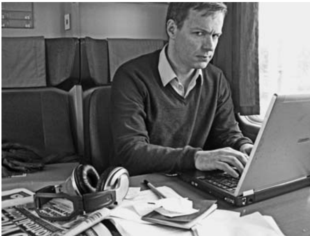
W pociągu do Warszawy, paranoja w oczach.