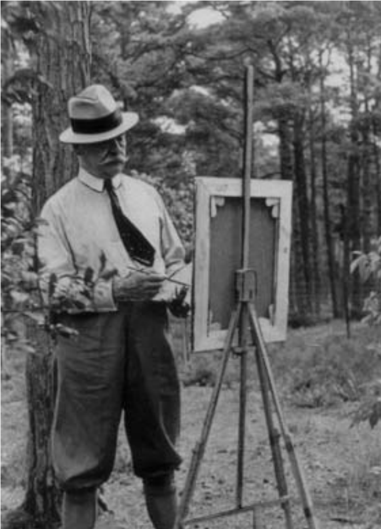
Wojciech Kossak, Jurata 1937