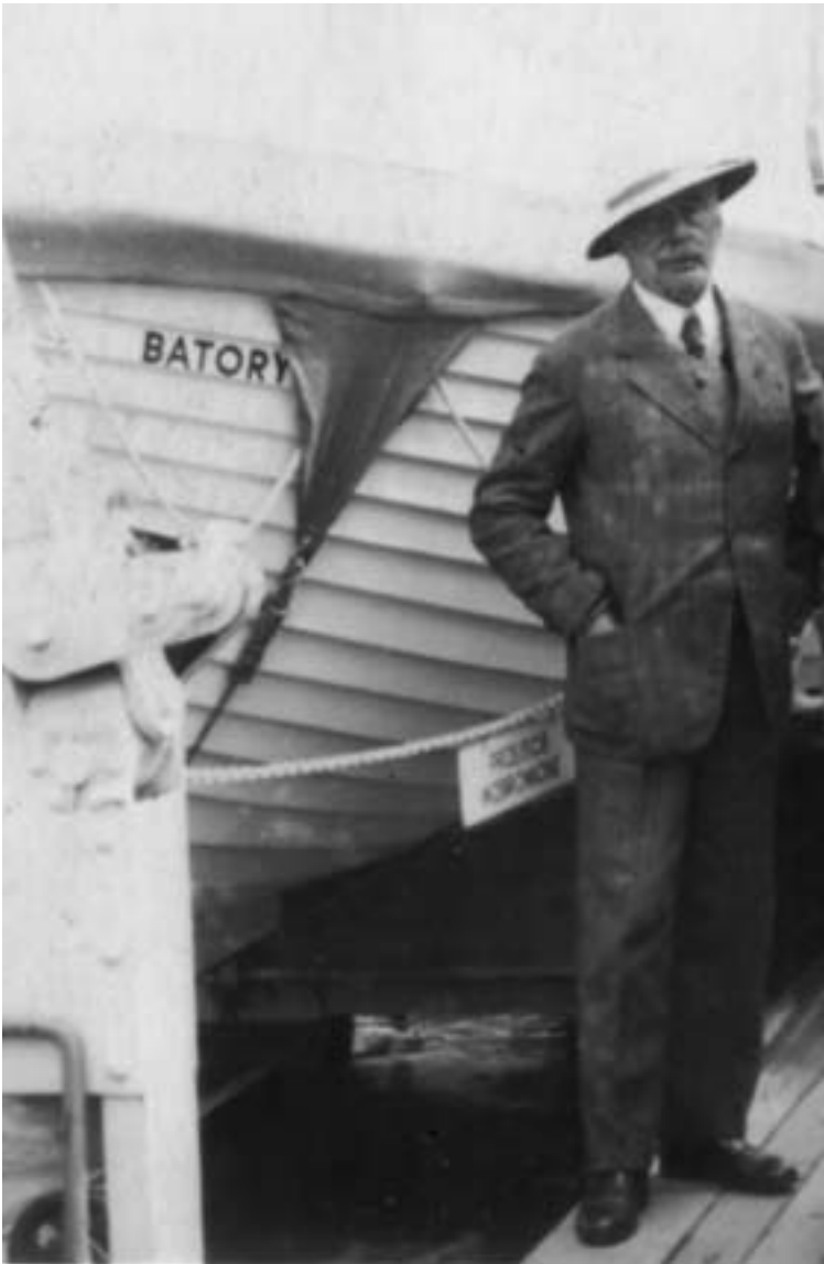
Wojciech Kossak, Kair 1937