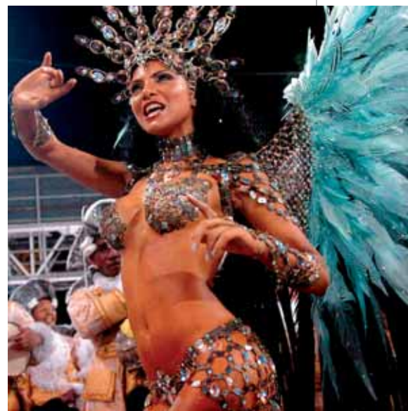
Fot. 3. Tancerka tańcząca sambę w czasie karnawału w Rio