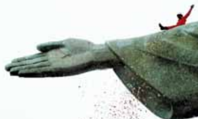
Fot. 2. Fragment figury Chrystusa Odkupiciela