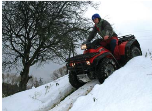
Równia pochyła z o-kładem, fot. Waldemar Czado

Do takiego wniosku można szybko dojść rozumując następująco: energia potencjalna ciała w naszym przypadku zależy tylko od zmiennej y :