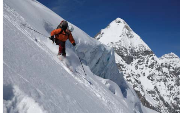
Test rozpraszania śniegu na równiach

Jesteśmy także wprowadzeni w problem, którego rozwiązanie proponowane jest na gruncie dwóch teorii dających różne wyniki, a rezultaty odpowiednio zaprojektowanego doświadczenia rozstrzygają, która teoria jest prawdziwa. Problem polega na ocenie sytuacji przez obserwatora patrzącego z góry, a ściślej jaką siłę zmierzy obserwator kierunku poziomego działającą na ciało zsuwające się z równi?