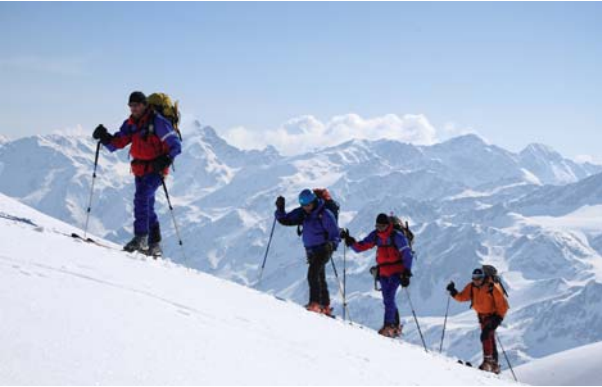
Podwyższanie energii potencjalnej, by zjechać

ni siły równoważą się (na tym polegała genialna idea Galileusza rozcieńczania grawitacji przy użyciu równi), a poza tym ze względu na prostopadłość i tak nie mają wpływu na ruch ciała wzdłuż równi. Z tych powodów nie narysowano ich na rys. 1.”